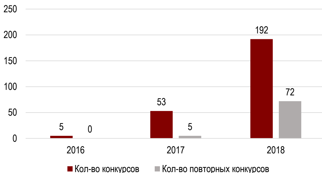
Рис.1. Количество проведенных конкурсов по выбору РО ТКО, ед.

Первые конкурсы по выбору РО ТКО были объявлены в 2016 году в 4 субъектах РФ: